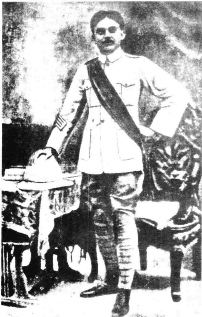
হাবিলদার-বেশে নজরুল ইসলাম : ২১ বছর বয়সে

‘নজরুল অ্যালবাম’ (অক্টোবর ১৯৯৪), নজরুল ইসটিটিউট, ঢাকা থেকে সংগৃহীত